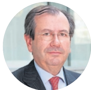
FERNANDO VIVES PRESIDENTE EJECUTIVO DE GARRIGUES

Por otro lado, también preocupa la sostenibilidad de las propias firmas (aunque muchos admiten en privado que el año 2020 está yendo mucho mejor de lo que cabía esperar en mayo-junio) y saber adaptarse a las nuevas necesidades de unos clientes que, más que nunca, están exigiendo más por menos. 2021 se presenta como un ejercicio decisivo en el sector.